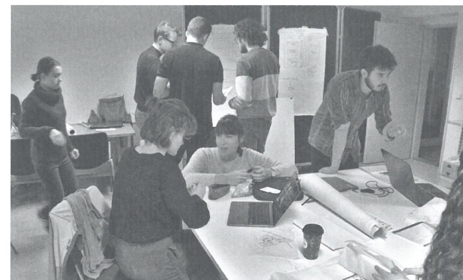
WORKSHOP V BRNĚ SE STUDENTY ARCHITEKTURY Z DRÁŽDAN A BRNA A URBANISMU Z BRESTU